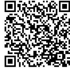
e 転居 (スマートフォンサイト)

最寄りの郵便局窓口に備え付けの転居届はがきに必要な事項をご記入の上、 郵便窓口へご提出頂くか、郵便ポストへご投函下さい。 スマートフォン・PCから「e 転居」サイトへアクセスしてのお手続も 可能です。